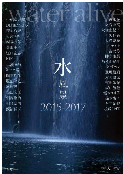
『水風景 VOL,3 2015-2017』表紙