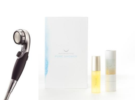
ピュアシャワーとヘアオイルセット