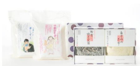
①獲れたて新米とごはんのお供セット 五ツ星お米マイスターが厳選した獲れたて新米の2種と昆布の老舗奥井海生堂の佃煮をセットに。ちよつとした、でも気の利いた手みやげや贈り物に。

<販売期間> 2016年11月4日(金)～12月20日(火)まで ※12月24日までの配送を承ります。(全国送料無料) <販売ルート> 「MIZUcafé PRODUCED BY Cleansui」店内 クリンスイウィンターギフト特設サイト( http://shop.cleansui.com/gift/16w/ )