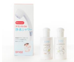
⑥浄水シャワーとベビーバスセット 髪と肌をやさしく洗い流す浄水シャワーとフランス生まれのベビー用シャンプーとコンディショナーセット。