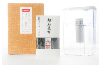
④極みの出汁セット WASHOKU シリーズから新発売の出汁をおいしくするためのポット型浄水器と昆布の老舗奥井海生堂・利尻昆布をセットに。