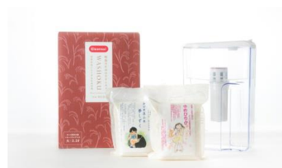
②獲れたて新米をさらにおいしくする水セット WASHOKU シリーズのお米をおいしく炊くためのポット型浄水器と五ツ星お米マイスターが厳選した獲れたての新米2種のセット。