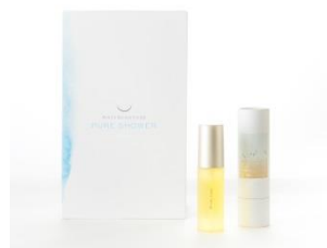
⑦ピュアシャワーとヘアオイルセット 水道水を髪と肌にやさしい軟水に変えるピュアシャワーと乾燥した髪に潤いを与えるウカのヘアオイルで髪と肌にご褒美ケア。