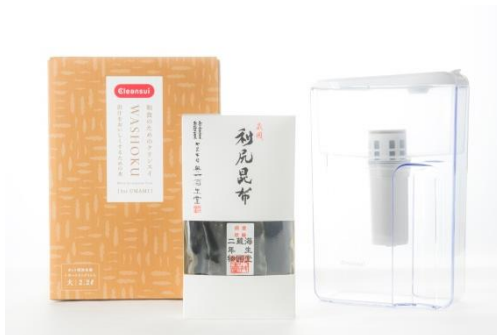
極みの出汁セット

三菱レイヨン株式会社(本社:東京都千代田区、社長:越智仁)のグループ会社である、浄水器、医療用水処理装置の販売を行う三菱レイヨン・クリンスイ株式会社(本社:東京都品川区、社長:池田宏樹 以下、当社)が展開するカフェ「MIZUcafé PRODUCED BY Cleansui」(東京都渋谷区神宮前6-34-14 原宿表参道ビル1F 以下、MIZUcafé)では、冬の食卓を彩るアイテムや、癒しのバスタイムを演出するグッズを集めた「MIZUcafé + Lifestyle Store ウィンターギフト」(全8種)を、2016年11月4日(金)より販売いたします。