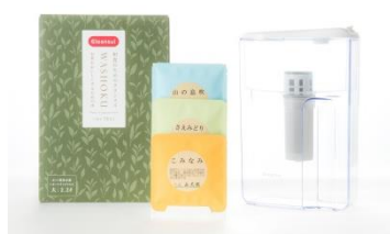
③銘茶飲み比べセット WASHOKU シリーズのお茶をおいしく淹れるためのポット型浄水器と日本茶インストラクターが選ぶ静岡産緑茶の3品種飲み比べセット。