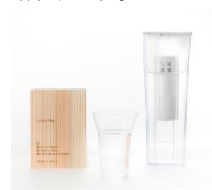
⑤浄水ポットと MIZU グラスセット 冷蔵庫のドアポケットに入るコンパクトなポット型浄水器と職人手づくりの美しい MIZU グラスで、美味しい水割りなど、おうち飲みを楽しむのはいかがですか。