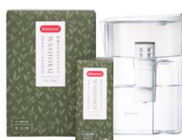
お茶をおいしくするためのポット型浄水器