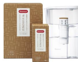
出汁をおいしくするためのポット型浄水器