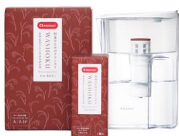
お米をおいしくするためのポット型浄水器