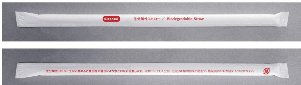
「BioPBS™」ストローイメージ

「 ミズカフェ MIZUcafé PRODUCED BY Cleansui」にて採用する生分解性ストローは、4月から京急グループ各社が運営する飲食店、百貨店、ホテルなどで採用され、5月からはワシントンホテル(株)や飲食店でも採用されています。