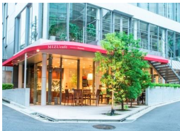
ミズカフェ 「MIZUcafé PRODUCED BY Cleansui」外観