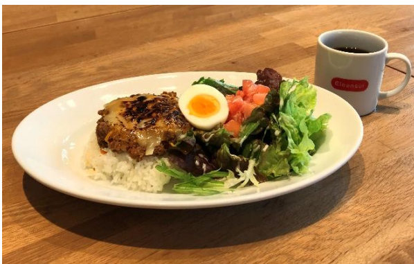
丹野こんにゃく入りライスの バイクドチーズキーマカレー (ドリンク付き) 1,250 円 (税別)