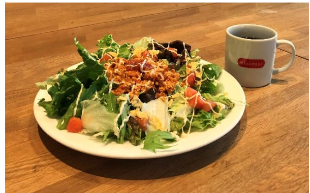
丹野こんにゃく入りライスの タコライス (ドリンク付き) 1,250 円 (税別)